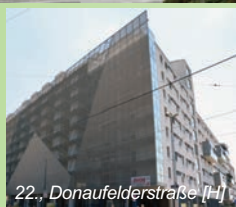
22., Donaufelderstrasse [H]