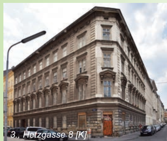
3., Hetzgasse 8 [K]