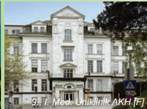
9., I. Med. Uniklinik AKH [F]