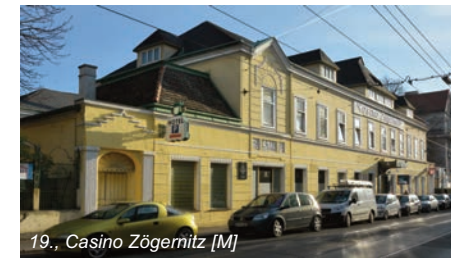
19., Casino Zögmütz [M]