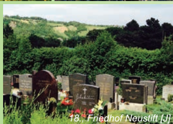
18., Friedhof Neustift [J]

Wir fordern Transparenz und Auskunftspflicht , umfassenden Informationszugang sowie Parteilichkeit für Bürger zur Wahrnehmung des öffentlichen Interesses in allen für Natur- und Kulturgüterschutz relevanten Verfahren.