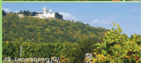
19., Leopoldsdorf [G]