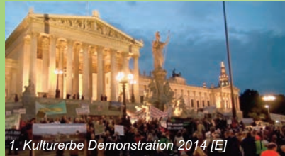
1. Kulturerbe Demonstration 2014 [E]

Weitere prominente Unterstützer finden Sie auf unserer Website www.kulturerbewien.at