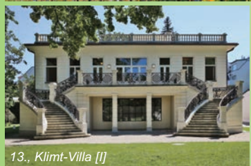
13., Klimt-Villa [I]