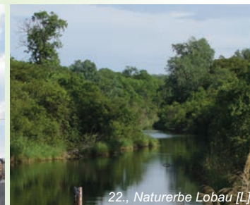
22., Naturerbe Lobau [L]