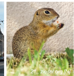
21., ziesel.org [N]