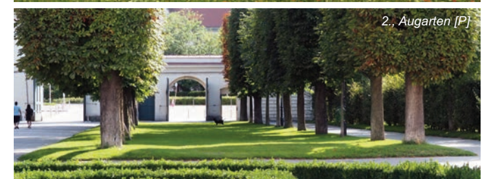
2., Augarten [P]