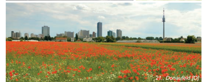
21., Donaufeld [O]